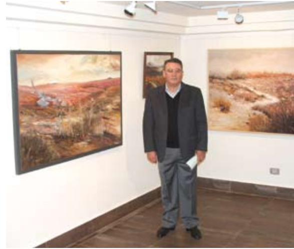
Color y vida. Enrique Sarabia.

Fechas: 9 octubre - 27 noviembre. Artista: Karlos Viuda. Exposición donde el ganador del Premio Carriegos de Pintura en 2002 mostró a los espectadores una colección de obras de transición, consideradas por el propio autor como muy íntimas y en las que persigue reflejar el paso del tiempo en los objetos.